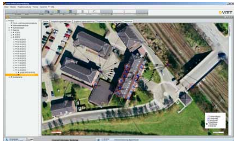
Übersichtskarte zur Darstellung überwachter Punkte